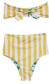
Loulou Au Bon Marché rive gauche, top 145 €, bas 158 €.