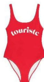
Touriste, 65 €.