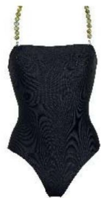
Dolla Maillot, 185 €, bretelles, 95 €.