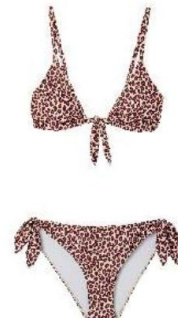
Ysé Haut, 55 €, bas, 30 €.