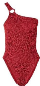
Hunza G Chez net-à-porter, 190 €.